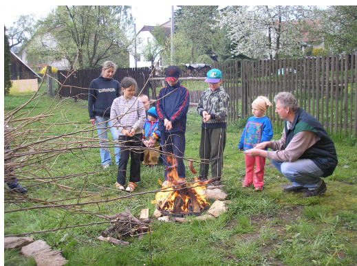
Pálení čarodějnic v r. 2011

Obec žádá všechny obyvatele, chalupáře i podnikatele o šetření s pitnou vodou. Vydává zákaz zalévání zahrádek apod. V obecních studních je vzhledem k dlouhotrvajícímu suchu podstav vody. Děkujeme.